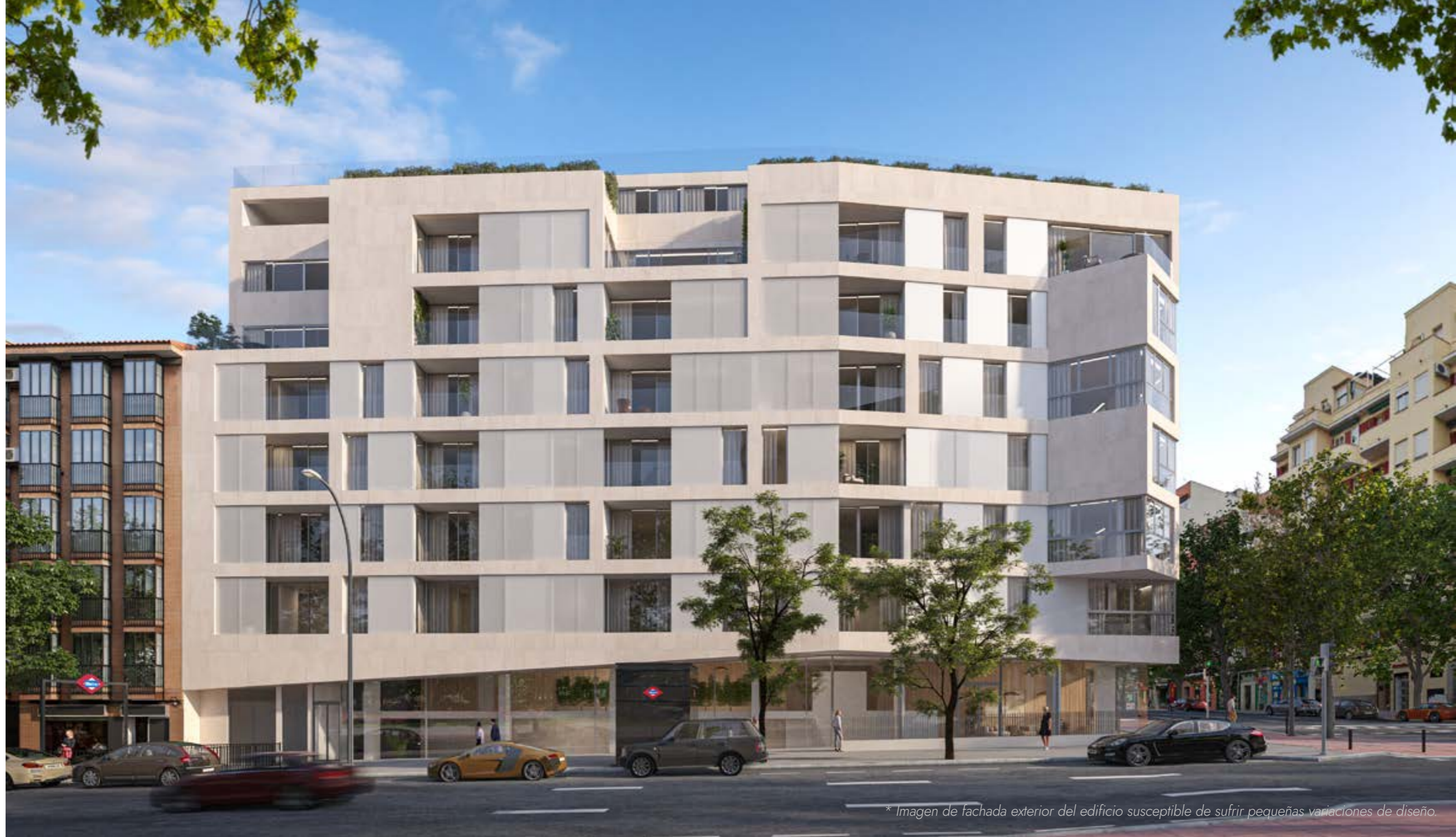
* Imagen de fachada exterior del edificio susceptible de sufrir pequeñas variaciones de diseño.